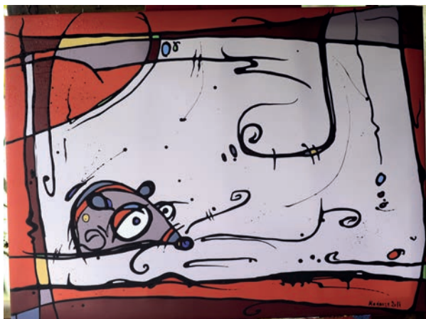
Mauswanderung, 100 x 75 cm, 2014, technique mixte