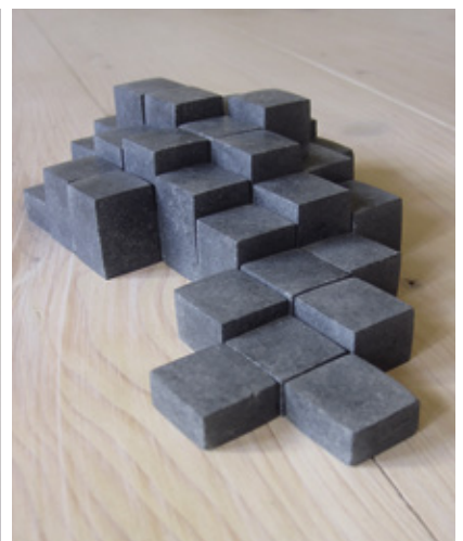
Grundsteine (Modell) 2016 Angedachte Größe 0,80 m Höhe, 2,4 m x 3,60 m, Thema: Menschenrechte