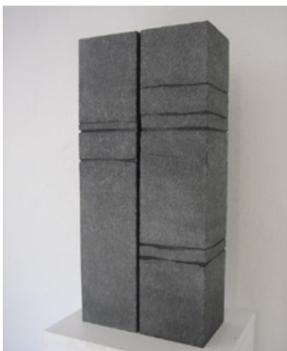
Was du denkst und ich meine, 2016 48 cm x 22 cm x 11 cm, Material Impala Thema: Missverständnisse