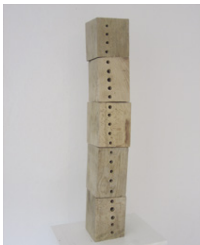
Tragwerk 60 cm x 9 cm x 11 cm, Buche 24 Wirbel, tägliche Alltagslasten