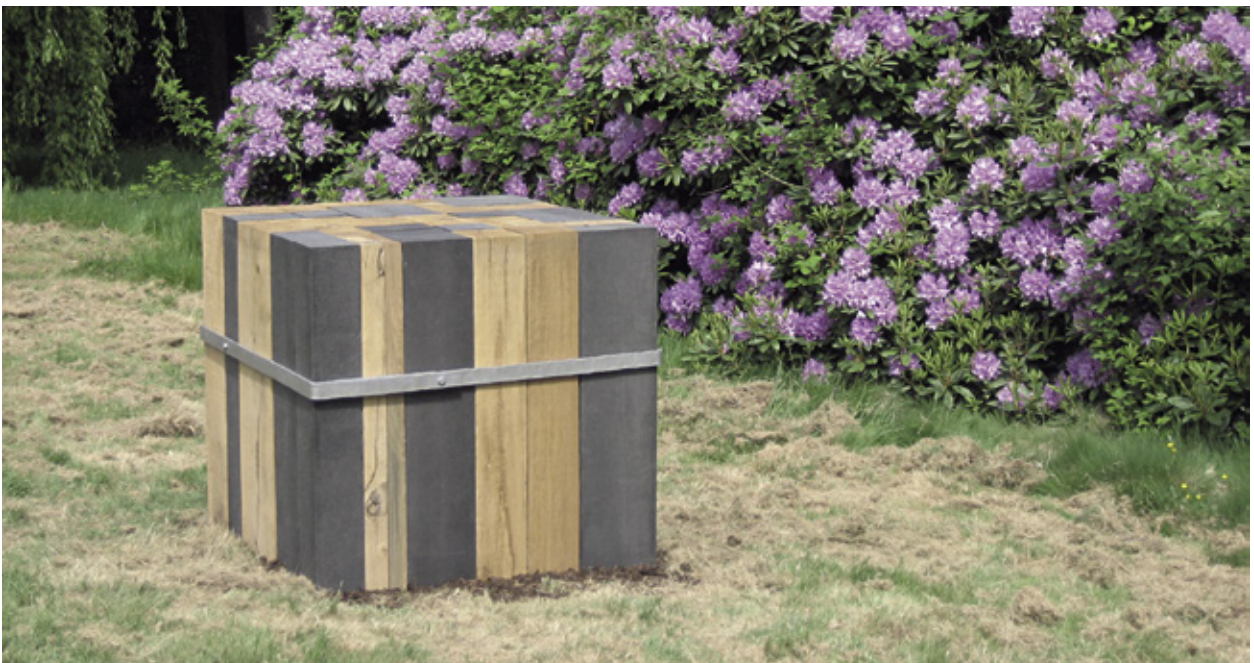
Raummeter Schloss Kalmuth, 2015, 1 m x 1 m x 1 m, Basalt, Eiche, Eisen, Thema: Grenzüberschreitungen

Elle préfère travailler la pierre de basalte. Elle s’explique comme suit: Dans les écoles supérieures on est fort influencé par d’autres artistes et leurs travaux ou oeuvres. Je ne voulais pas m’exposer à cela. Je préfère des formes simples avant de commencer la réalisation de grands objets en pierre. Beaucoup d’idées me tournent dans la tête et je démarre par la réalisation de petits modèles en pierre. Pendant que je travaille sur des petits modèles, j’essaie d’arriver à la forme finale. Durant ma formation j’ai appris la précision du travail artisanal, de laisser à la pierre le temps, de la manipuler correctement. Durant ce procès de formation, que l’on doit donner à la matière durant la transformation,